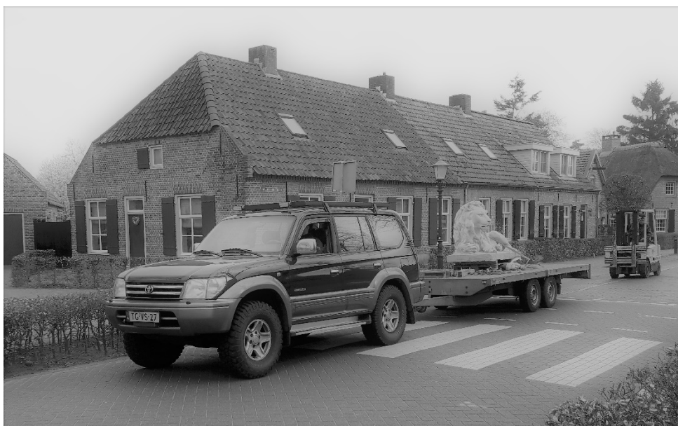
Transport van de leeuw

De leeuw is in samenwerking met Bas Timmermans (BTM metaal) verplaatst naar zijn uitgezochte plaats, waarna hij in de komende weken zal worden gerepareerd van kleine scheurtjes en van de definitieve kleur wordt voorzien.