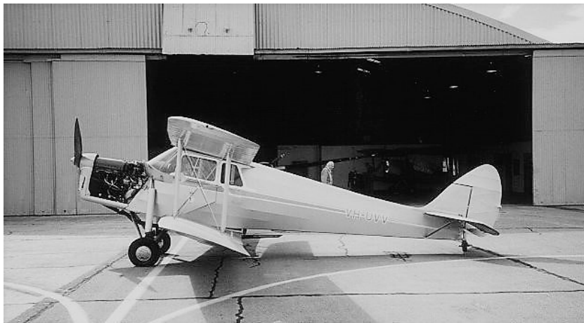
Dit type toestel landde in Oostelbeers