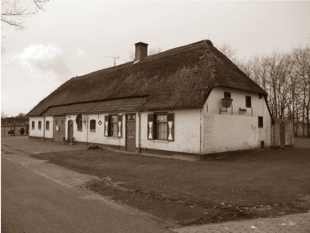
Woonhuis aan de Steenfortseweg 11 in Middelbeers