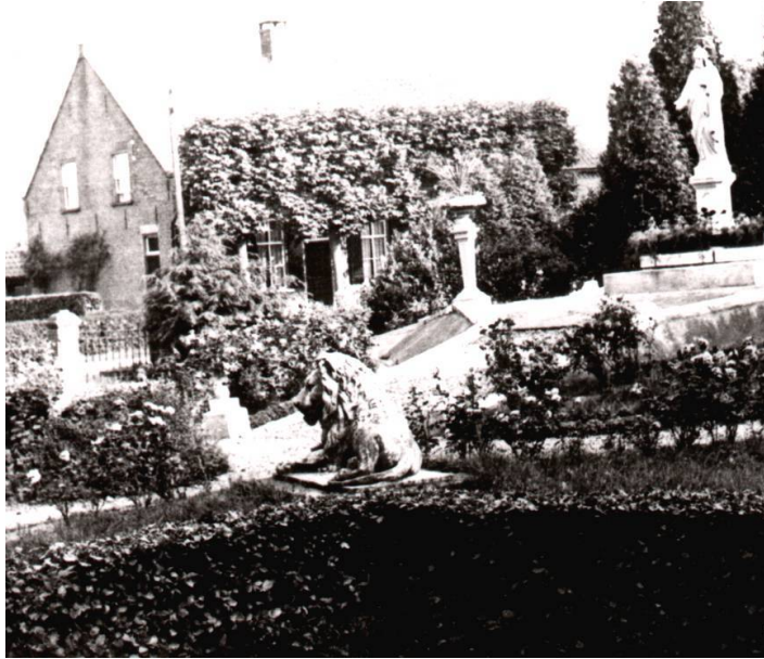
Voormalige H. Hartplein

De stenen leeuw stond op het voormalige H. Hartplein, huidige Doornboomplein. Stenen leeuwen werden vaak geplaatst voor een belangrijk gebouw en bij de poort