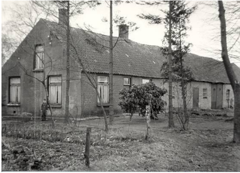
Woning Kuikseindseweg zigt was, in het (oude) kerkje van Middelbeers. Middelbeers wordt in de carnavalstijd "Strijkersgat" genoemd en de Beerse Bakker heeft in zijn assortiment een gebak genaamd "Strijker".