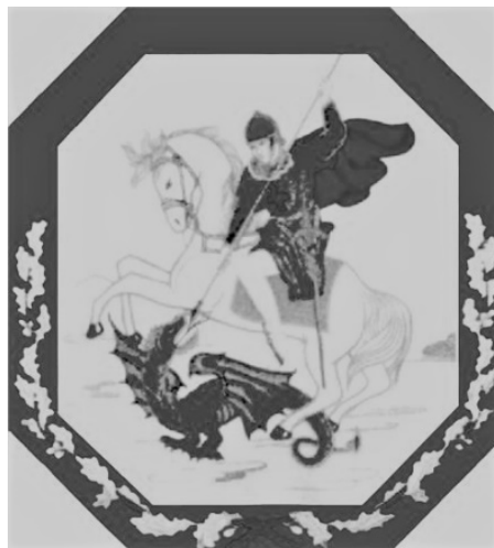
Logo St. Jorisgilde.

Goede raad was duur, verrekijsers werden erbij gehaald. Uiteindelijk werd besloten de schutsboom neer te halen om vanaf de begane grond het probleem met kennis van zaken op te lossen. Inderdaad had een revetje een stukje van de vogel op de paal vastgehouden. Er werd besloten verder te schieten. Na enkele schoten maakte koning Piet van der Velden aan alle onzekerheid een einde. Het laatste stukje van de vogel fladderde naar beneden en Piet prolongeerde daarmee voor de komende 5 jaar zijn koningschap.